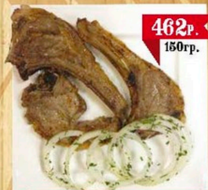
Баранина на кости