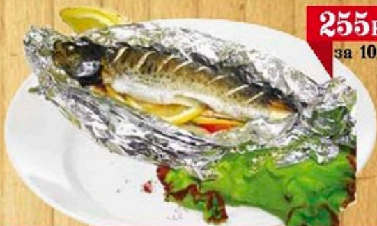
Форель речная запеченная в фольге