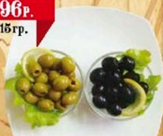
Оливки или Маслины