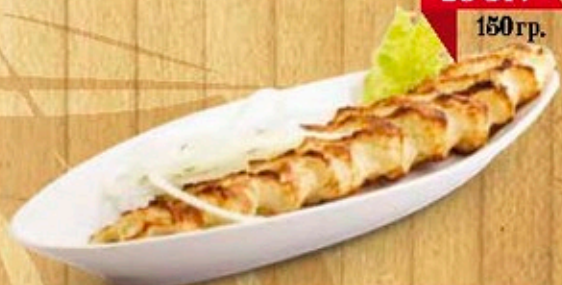
Люля-кебаб из картофеля