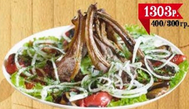
Каре ягненок «На троих»

(филе баранины, помидоры, болгарский перец)