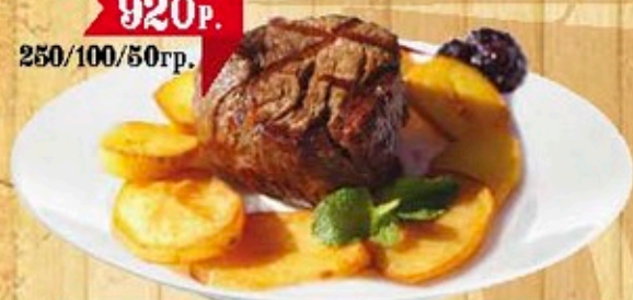
Стейк из говяжьей вырезки