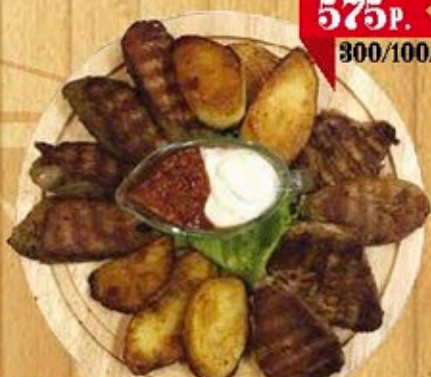
Свиная вырезка запечённая со специями