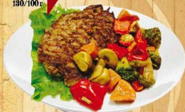
Отбивная из говядины с овощами

(говяжья вырезка, перец, морковь, грибы)