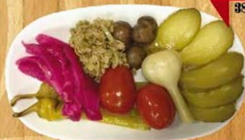
Солености с джонджоли

(помидоры, огурчики, капуста квашеная, чеснок, шампиньоны, перец острый стручковый, джонджоли)