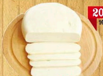
Сыр домашний "Сулугуни"