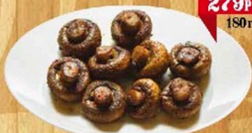
Шашилык из грибочков