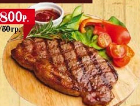
Рибай стейк из мраморной телятины