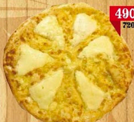
«По - Царски»