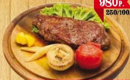
Мраморный стейк из телятины