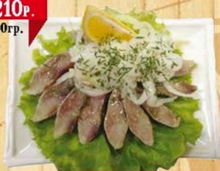
Сельдь с луком и лимоном