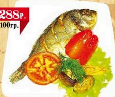
Дорадо жареная с гарниром

(перец болгарский, томаты, грибы, лимон)