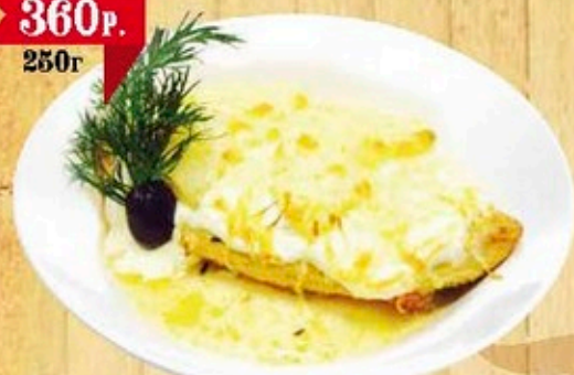
Куриная грудка с ананасами под сыром