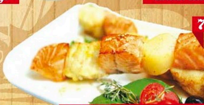
Ассорти рыбное на углях