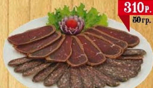
Суджук или Бастурма