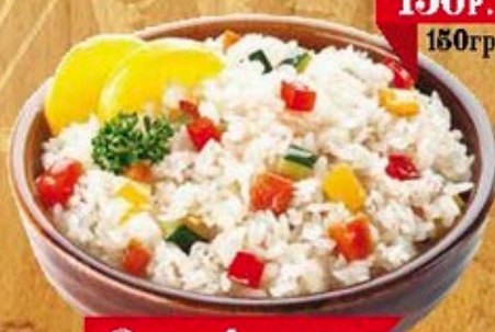
Рис с овощами