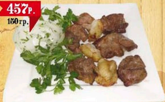
Мякоть баранины с курдюком